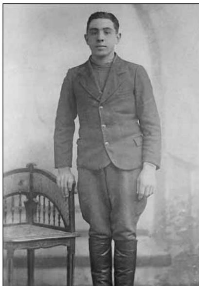
Кущовий провідник ОУН Йосип Дунець – «Грізний»