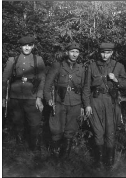
Неідентифіковані підпільники з Золочівщини