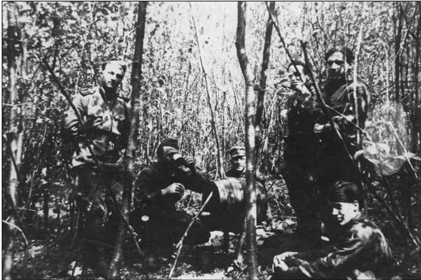
Повстанці Золочівщини на пості