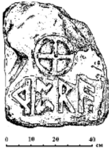
Камінь з рунами з гори Опук

До опукської знахідки зверталися різні дослідники, підходи яких іноді є діаметрально протилежними. Так, археологи В. Голенко (1955–2008 рр.) та О. Джанов 1 , які, власне, знайшли і опублікували артефакт, а також О. Хлевов 2 притримувалися думки про його автентичність. Натомість М. Щукін (1937–2008 рр.) 3 та Н. Ганіна 4 притримувалися обережного оптимізму щодо знахідки. І, врешті, М. Федосєєв 5 вважав рунічний камінь сучасним фальсифікатом. Не відкидаючи можливість фальсифікації, яка завжди присутня в подібних знахідках, ми дотримуватимемося “презумпції невинності” щодо каменя, а під час його подальшого аналізу скористаємося методологією нового самостійного напрямку досліджень, що виник близько чверті століття тому і отримав назву “візуальних